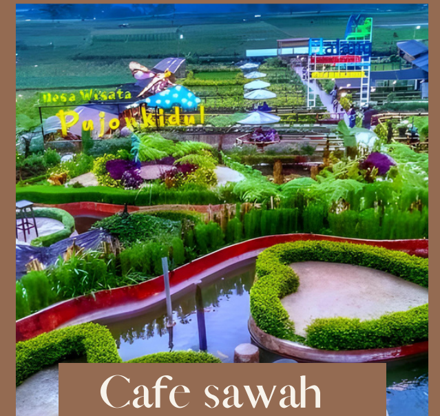
Cafe sawah pujon